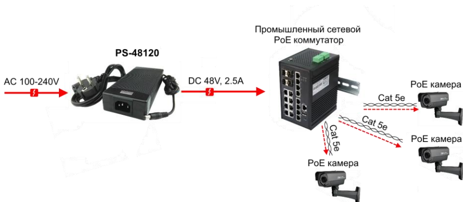
Рис.3 Типовая схема подключения блоков питания на примере PS-48120