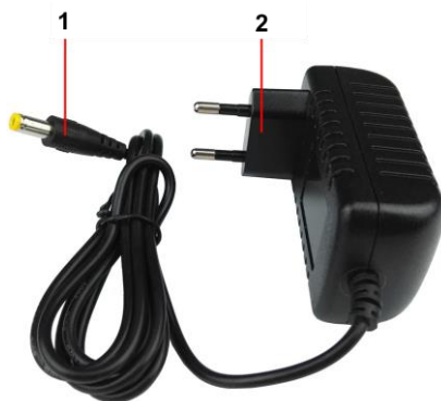
Рис. 1 Блок питания PS-48024, внешний вид, разъемы